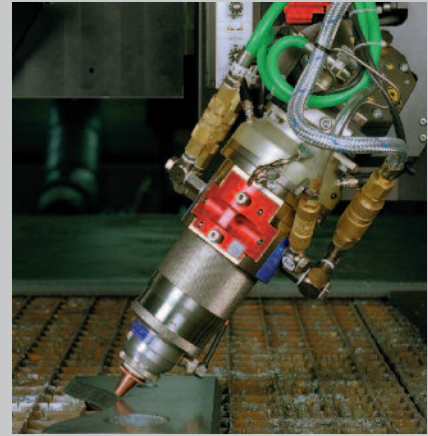
Kontinuierliche Fasenverstellung bis 50° Continuous Beveling up to 50°